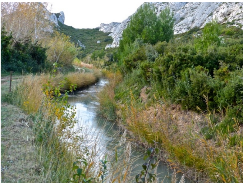
Au long du canal de la Vallée des Baux

Longueur : 13 km - Dénivelé positif cumulé : 250 m - Durée : 4 h 30 - Particularités : le suivi de l'itinéraire demande un peu d'attention à l'ouest du Pas du Loup