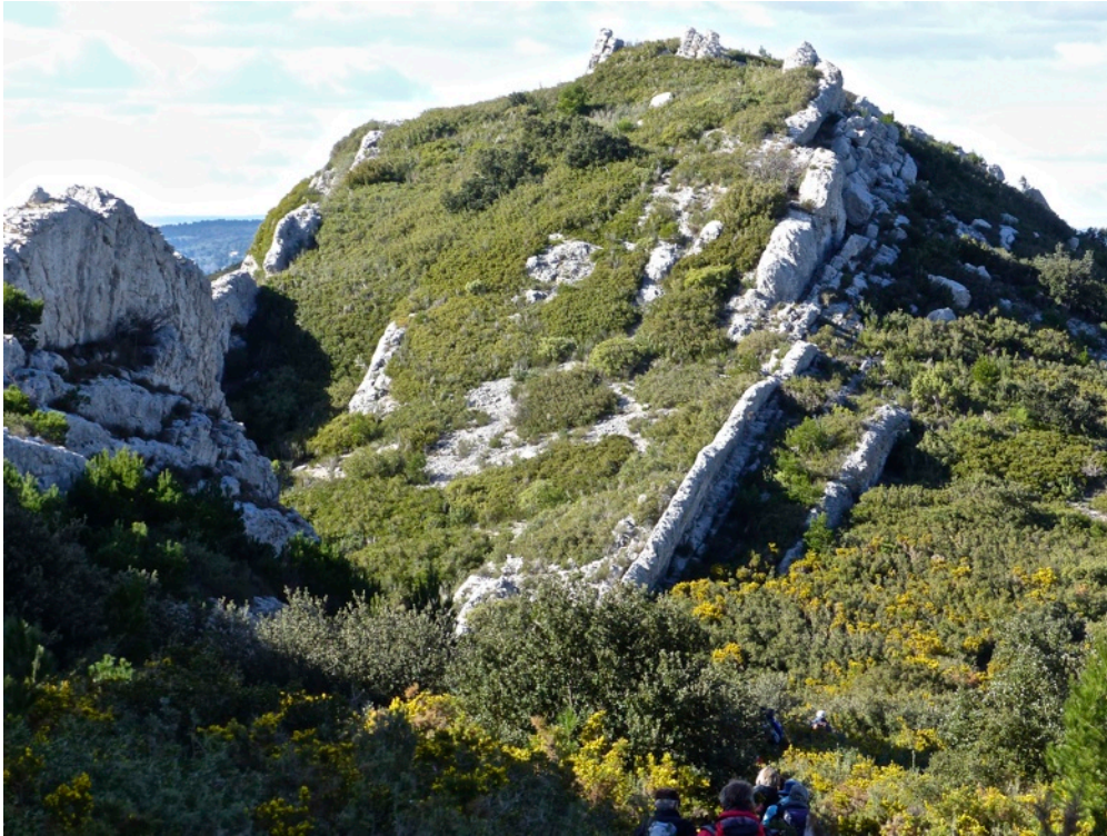
La crête du Castellás à l'ouest du Pas du Loup

Passer au dessus du canal, laisser une oliveraie à main droite et trouver un sentier à proximité du vallon. L'emprunter à gauche, parvenir à une nouvelle oliveraie et prendre plein sud entre oliveraie et garrigue. On parvient à un petit canal d'irrigation que l'on suit pour contourner la partie ouest du Castellás. Poursuivre par un chemin et rejoindre une piste.