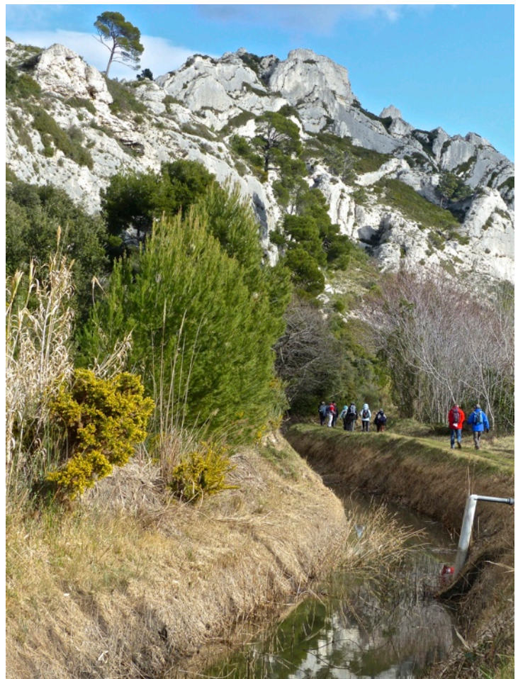
Le canal de la Vallée des Baux

④ La prendre à gauche, passer devant la porte d'entrée et sa belle arche de pierre du Mas de Chanousses, et monter à gauche par un chemin vers le canal. Suivre le canal de la Vallée des Baux en direction de l'est. A gauche, remarquer l'inflexion du canal vers le nord pour passer en tunnel sous la colline du Castellás. Longer le canal dominé par de belles falaises blanches, laisser à droite le Mas du Fou et la Plaine des Chanousses couverte d'oliveraies, et atteindre le point (3). Prendre à droite la petite route empruntée à l'aller jusqu'au point (2). À ce carrefour continuer tout droit. La route tourne à angle droit à gauche pour franchir le ruisseau, puis à droite. À ce niveau négligez le chemin de gauche emprunté par le GR 653A (poteau directionnel) et cheminer encore 400 mètres jusqu'au départ sur la gauche d'un sentier.