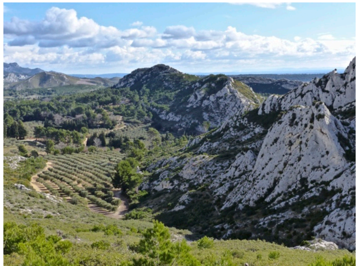
Vallon à l'est du Pas du Renard

3 La franchir pour passer en rive droite et remonter le canal sur 200 mètres environ. Laisant à gauche une oliveraie, le sentier s'écartere du canal et monte dans la garrigue. À la première bifurcation de sentiers, négligez celui de droite qui se dirige vers le Vallon du Renard et choisir celui de gauche. Dans une végétation d'ajoncs épineux, le sentier s'élève progressivement, surplombe à droite le spectaculaire Vallon du Renard tapissé d'oliviers et atteint le Pas du Loup. D'en haut la vue circulaire est immense : Cévennes, Pic Saint-Loup (près de Montpellier) la mer qui brille dans le Golfe de Fos ; La Sainte-Victoire, et vers l'est; le massif des Opies (point culminant des Alpilles) ainsi que la Barre des Civadières. Toujours en