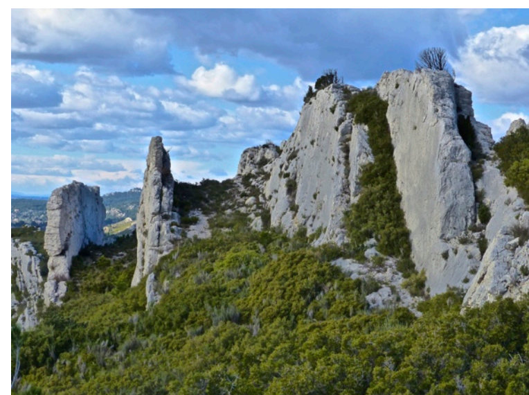
Lames calcaires sous le Pas du Renard

direction de l'ouest la descente s'amorce vers un joli site où l'érosion a ciselé de belles aiguilles dans les lames calcaires donnant un aspect féérique à ce paysage. Le sentier descend ensuite sur le versant nord et atteint une zone clôturée. Rester au dessus de la clôture ; dans une zone un peu encombrée de végétation, l'itinéraire se poursuit toujours vers l'ouest laissant à gauche une barre rocheuse. On remarque bientôt en contrebas le canal bétonné de la Vallée des Baux à sa sortie du tunnel passant sous la crête rocheuse du Castellans. Le sentier se perd un peu mais il faut continuer à descendre jusqu'à ce point.