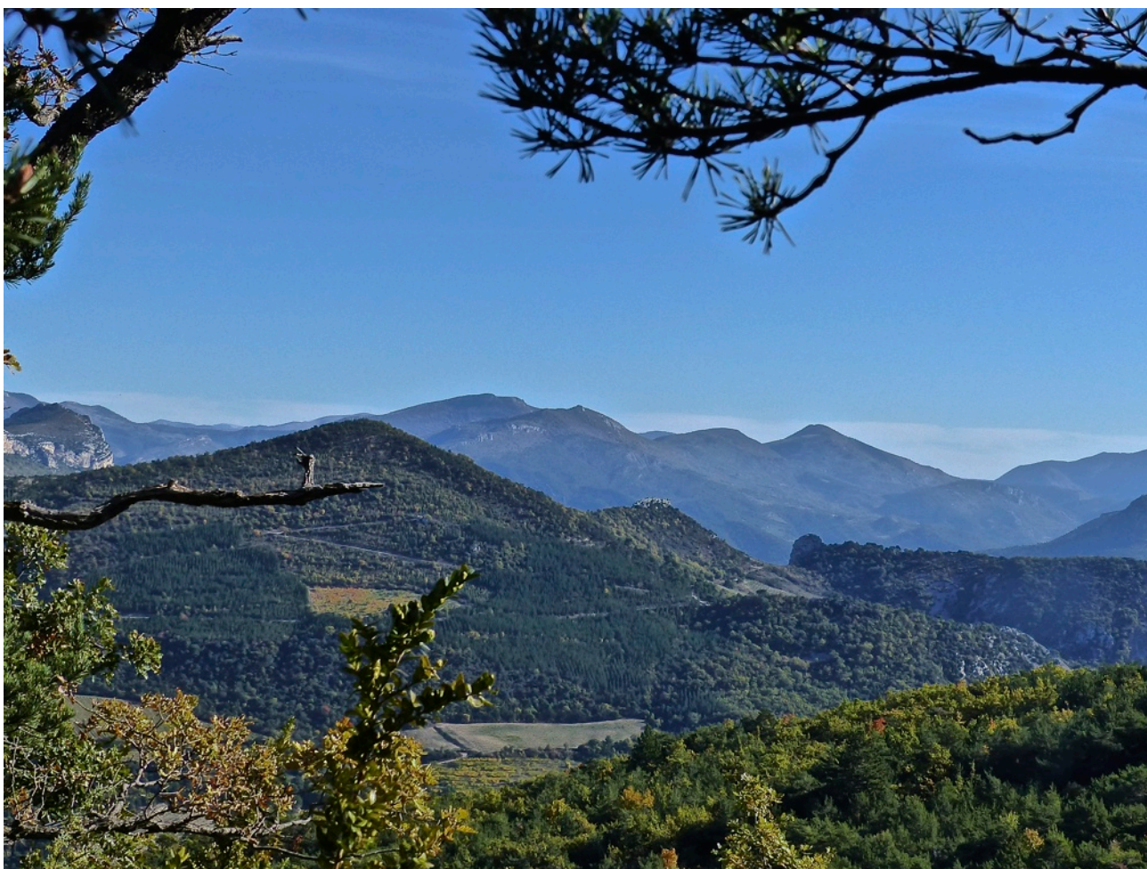
Perspective sur les Baronnies