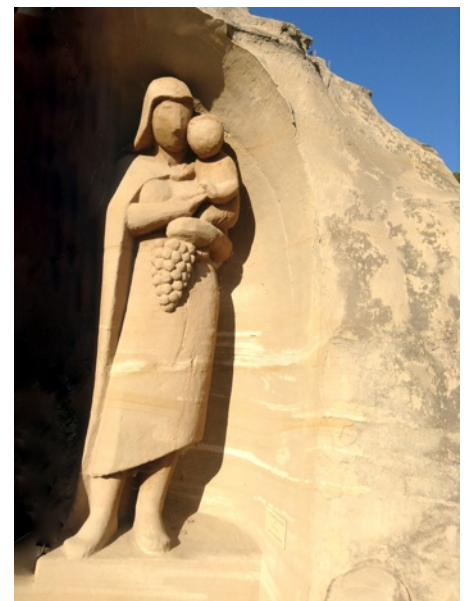
La Belle Vendangeuse et la Madone aux raisins -Jean-Pierre Eichenberger, 1997