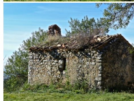
Village des Géants : ruines de maisons et de la chapelle