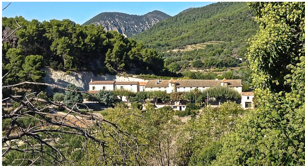
Le mas de Grangeneuve (XVIIe- XVIIIe siècle)

② Poursuivre tout droit en direction du mas de Grangeneuve entouré de vignes de vergers et d'oliviers. Le laisser sur la gauche, et, au carrefour suivant, choisir la droite en direction du Grand Verger. Longer un profond ravin sur la gauche, et au carrefour suivant, prendre à droite sur une centaine de mètres.