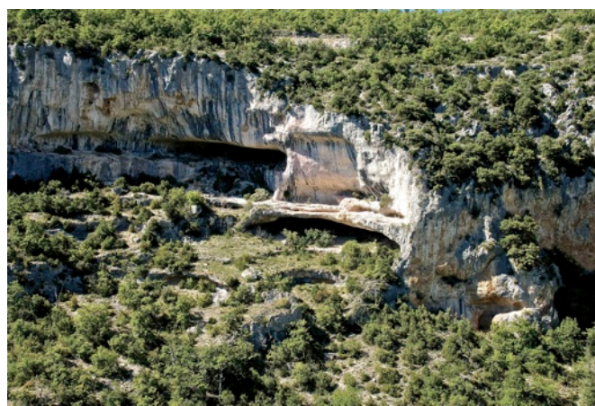
Beaume dans le massif du Rocher du Cire