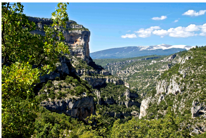
Le Rocher du Cire, le canyon de la Nesque et au fond, le Ventoux (ci-dessus)

4 Longer la falaise vers l'est sur quelques m et trouver un sentier orienté sud-est descendant dans un petit vallon. Parcourir environ 250 m et repérer sur la gauche un cairn signalant le départ d'un sentier.