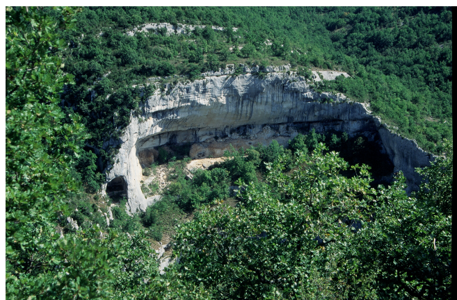
Beaume de l'Aubesier (ci-contre)