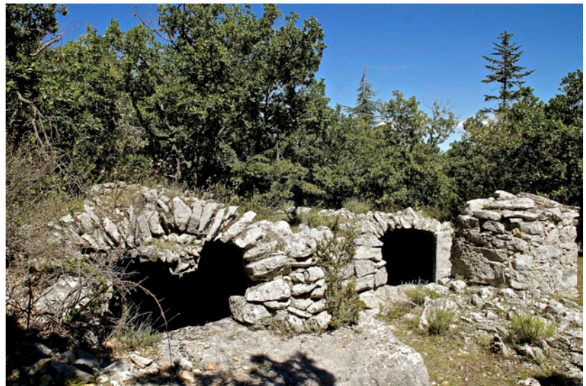
Aiguiers de Sicaude

8 Choisir à gauche le chemin (GR9) se dirigeant vers la Chapelle Saint-Michel. Quitter à gauche ce chemin pour un sentier aux couleurs du GR. Il laisse à droite le hameau de Sicaude et sa chapelle en ruines juste avant un coude du sentier. Progresser vers l'est, laisser à droite la ferme de Malaval et descendre au fond d'un vallon.