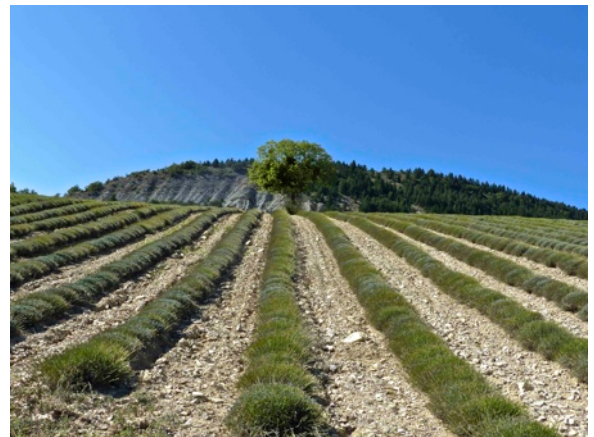
Champs de lavande vers la ferme de Morénas