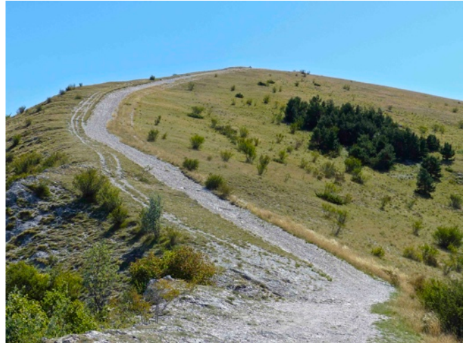
Sommet de la Montagne du Buc vu du Gros Collet Le Gros Collet vu du nord