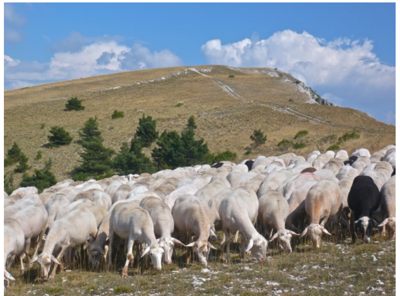
Le Collet Court peu avant le sommet de la Montagne du Buc

⑤ L'emprunter à gauche en direction est-sud-est pour gagner le rebord escarpé de la montagne du Buc. Par des alpages appréciés des moutons, se hisser jusqu'au Collet Court, puis au sommet de la montagne à 1442 m d'altitude (point géodésique). Vous ne serez pas déçu, un magnifique panorama circulaire vous y attend : au nord le massif du Vercors et celui du Dévoluy, avec bien reconnaissable, le Pic de Bure, plus à l'est et par temps clair le haut massif des Écrins, à l'est la vallée de la Méouge, affluent du Buech, au sud-est la Montagne de Lure et au sud l'imposant Ventoux. Tout en bas au nord, le village de Mévouillon-Gresse s'offre au regard. S'il n'y a pas trop de vent, le sommet peut être un joli lieu de pique-nique. La descente, souvent par une pente marquée qui fait rechercher l'herbe plutôt que la pierraille glissante, s'effectue plein nord en direction du Gros Collet, le long d'une crête de 2,5 km de longueur offrant de magnifiques vues aériennes. Le site est très apprécié des parapentistes que vous pourrez voir évoluer lorsque la météo leur est favorable. Ce sport est d'ailleurs très développé dans les Baronnies au relief varié. Le chemin atteint le bas de la crête au niveau d'une piste.