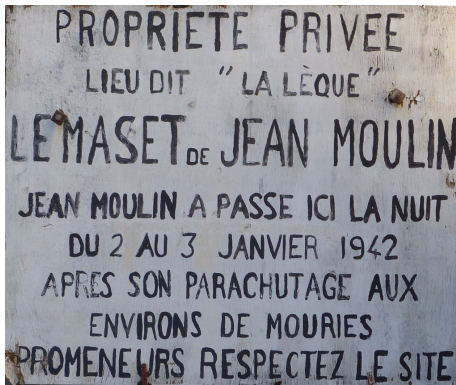
Caché dans les pins, le Mazet de Jean Moulin

P Du parking, se diriger vers le centre du village et prendre à droite l'avenue de la Lèque en direction sud-sud-est. Parcourir environ 1 km jusqu'à la fin du bitume et de la zone urbanisée et poursuivre tout droit sur une piste en terre sur quelques centaines de m. Repérer à droite un panneau signalant le mazet de Jean Moulin.