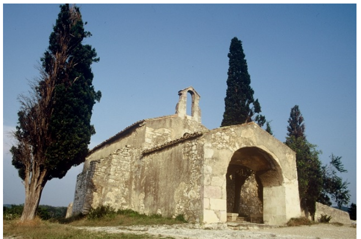
L'emblématique chapelle Saint-Sixte à l'est du village

Site d'habitat néolithique, le village d'Eygalière ses développa à l'époque romaine quand une légion vint capter les eaux de ses sources pour les conduire, par un aqueduc contournant les Alpilles par le Nord, jusqu'à la ville d'Arles. Il prit alors le nom d'Aqualeria (qui recueille les eaux) avant de devenir Eygalières. Un temple païen dédié aux eaux aurait alors été élevé à proximité du point de départ de l'aqueduc. C'est à l'emplacement de ce sanctuaire antique que fut construit au XII e siècle la chapelle rurale Saint-Sixte, petit édifice roman isolé sur un monticule rocheux planté de cyprès et d'amandiers : un des bijoux de la Provence.