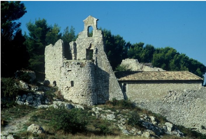
La chapelle des Pénitents Blancs