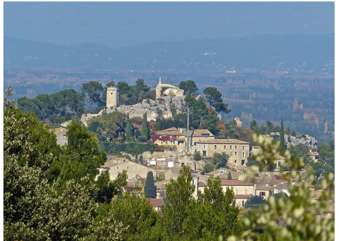
Eygalières vu depuis les Calans

⑥ L'emprunter à droite et se diriger vers Eygalières. À travers vergers et oliveraies, il coupe la D 24 b (prudence en traversant), laisse sur la droite le cimetière. Grimper à vue vers le sommet du village et sa tour. Eygalières mérite une visite. Il faut prendre le temps de flâner dans les ruelles avant de revenir au parking.