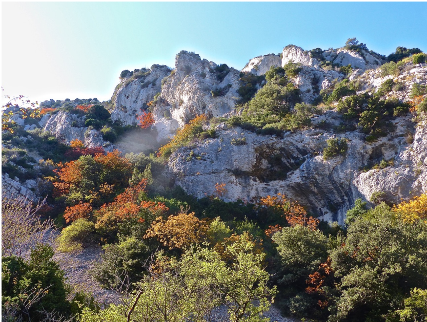
Partie orientale des Grands Calans

1 Aller à droite jusqu'à ce lieu de mémoire. Descendre au sud du Mazet vers une oliveraie. La longer en suivant le bois. Laisser à droite